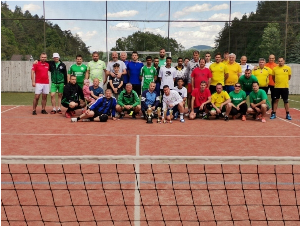
Nohejbalový turnaj v Malachove