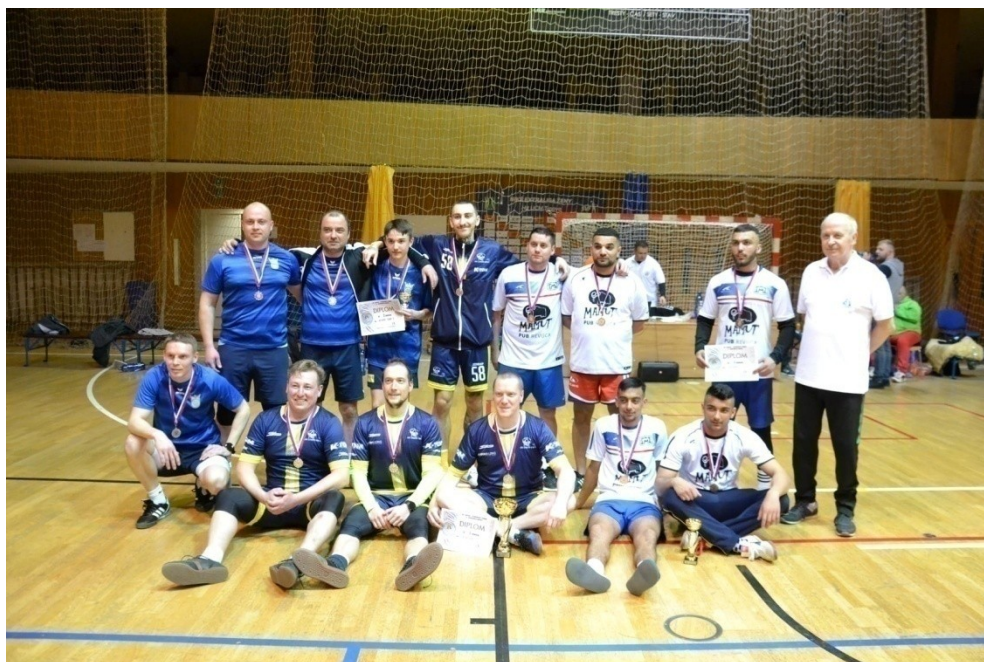
Turčianska nohejbalová liga 2022 - Diaková 26.3.2022