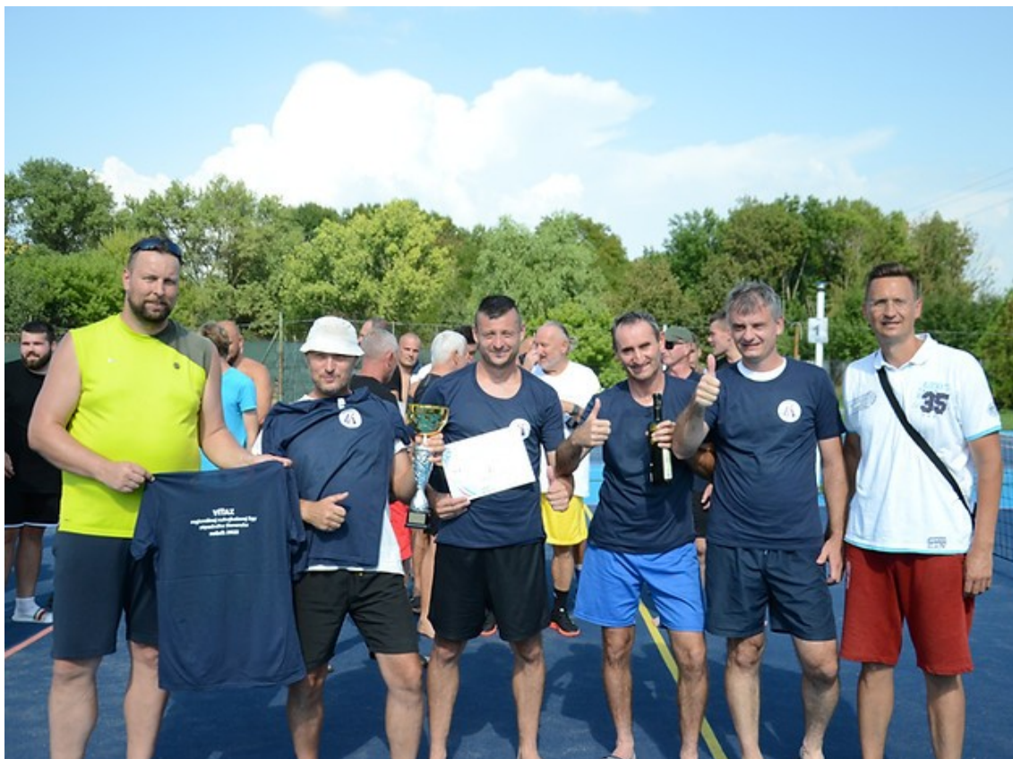
Finále regionálnej ligy Západ 2022