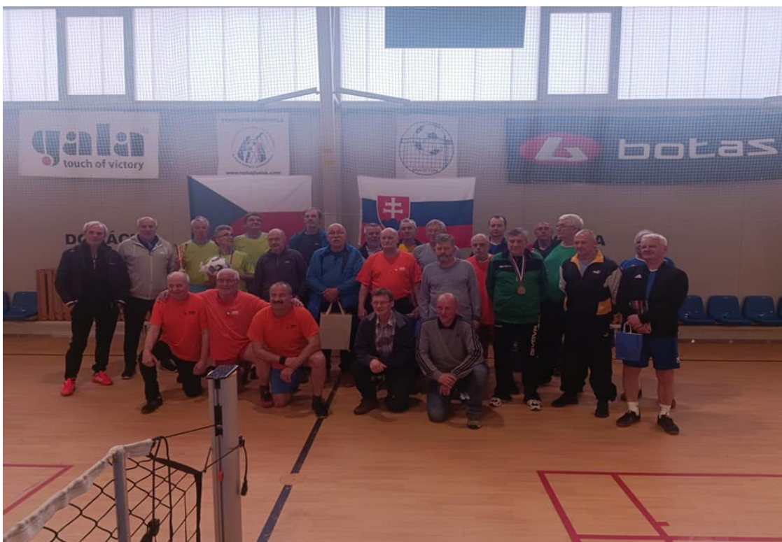
Nohejbalový turnaj Senior 60 +

Dňa 9.4.2022 v priestoroch športového centra Diaková NK Martin zorganizoval a uskutočnil nohejbalový turnaj Senior 60+.