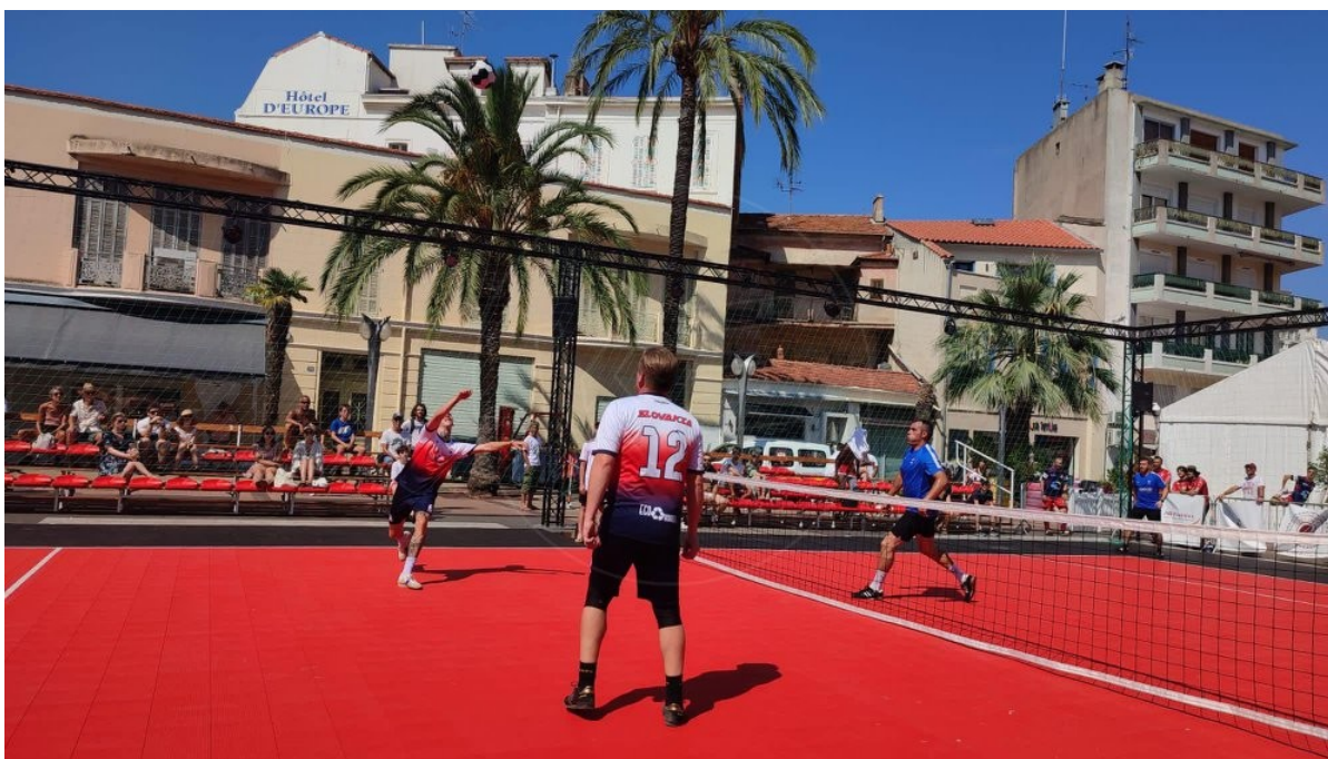
Zápasy sa hrali v atraktívnom mestskom prostredí

Reprezentačného trénera potešil progres oboch národných výberov. „Som veľmi rád, že po generačnej obmene dokážeme hrať s Čechmi aspoň vyrovnané partie. Verím tomu, že to vygraduje na svetovom šampionáte a ich domáce majstrovstvá sveta im čo najviac znepríjemníme.“