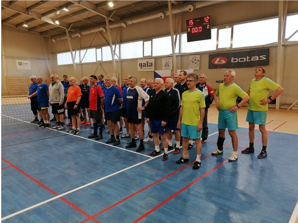
Memoriál Františka Halása - Nitra 28.5.2022