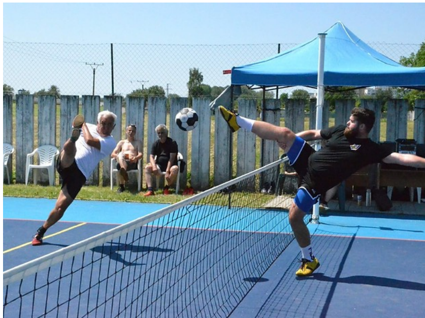
Nohejbalový turnaj v Topoľčanoch 2022

V rámci regionálneho rozvoja nohejbalu sa v sobotu 11.6.2022 uskutočnil v areáli letného kúpaliska v Topoľčanoch nohejbalový turnaj. Akcia sa konala pod záštitou Slovenskej nohejbalovej asociácie v spolupráci s miestnym Nohejbalovým klubom Topoľčany. Turnaja sa zúčastnilo 10 trojíc neregistrovaných hráčov zo západného Slovenska.