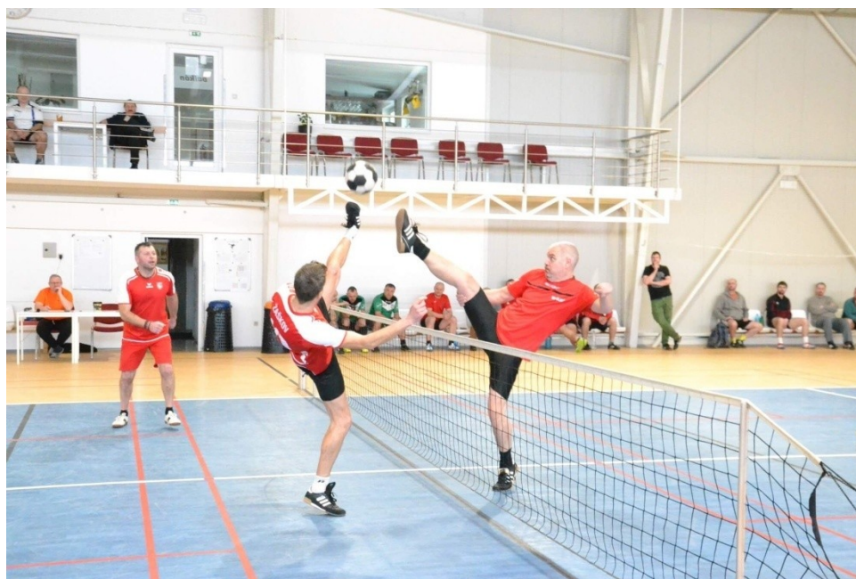
Turčianská nohejbalová liga 2022

Dňa 26.3.2022 sa uskutočnilo 8. kolo Turčianskej nohejbalovej ligy v Športovom centre Diaková. Po spresnení prihlášok na kolo, účasť potvrdilo celkom 8 družstiev, keď pravidelného účastníka NK Žaškov nahradilo družstvo NK Ružomberok.