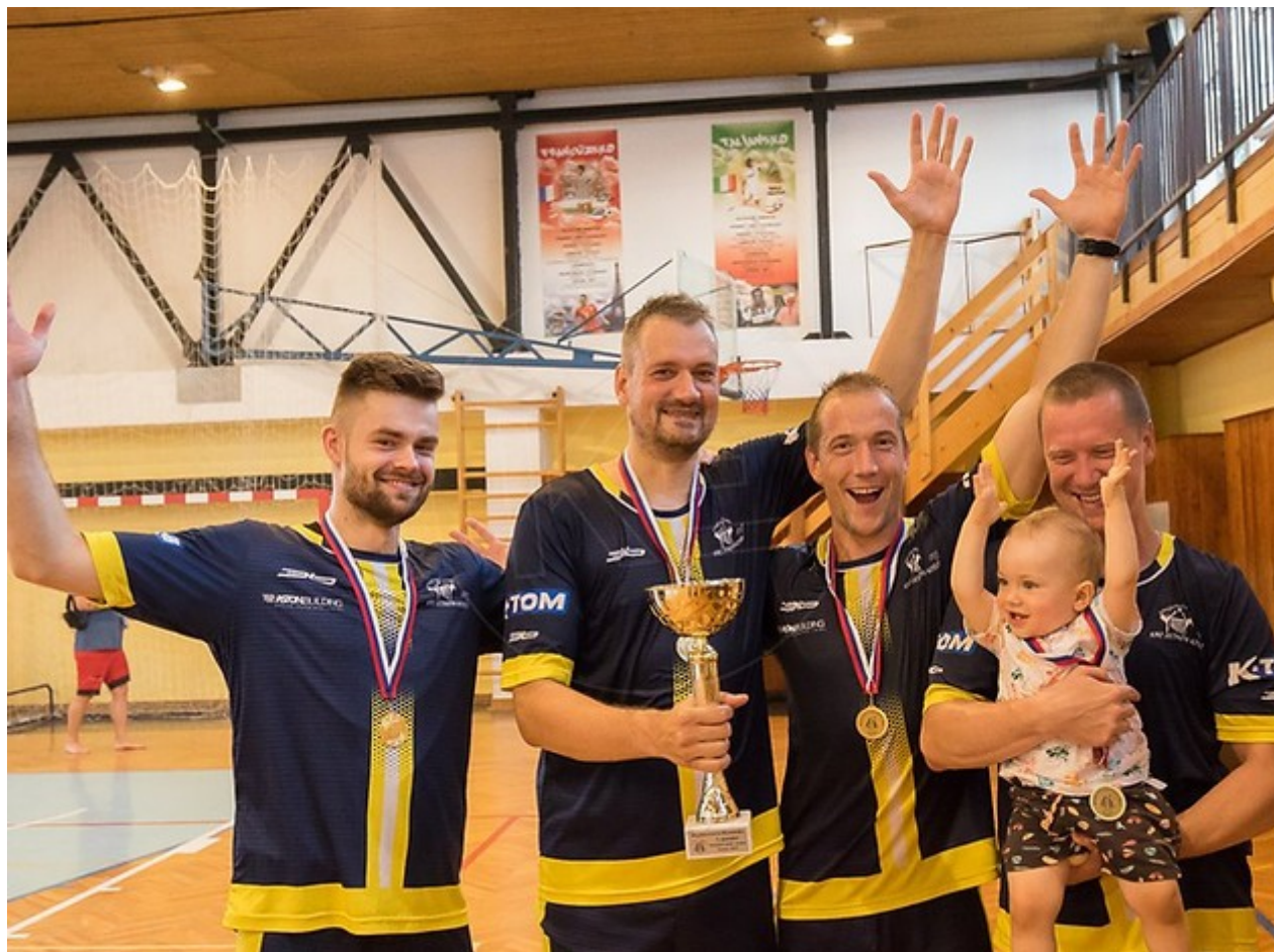
Majstrovstvá slovenska v nohejbale trojíc mužov 2022

Košická nohejbalová dominancia je v slovenskom športe unikátom. V kráľovskej kategórii trojíc vládne metropola východu pevnou rukou už od roku 1998. Štafetu po dlhoročnom hegemónovi DPMK (celkovo 28 titulov) prevzal KAC, ktorý získal počas uplynulého víkend v domácej hale na Bruselskej ulici už deviaty majstrovský titul.