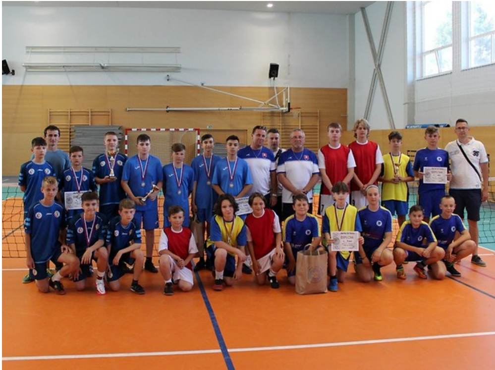
Majstrovstvá slovenská v nohejbale žiakov trojice Snina 2022

Počas víkendu 18. - 19. júna sa v mestskej športovej hale v Snine a strednej odbornej škole Snina uskutočnili Majstrovstvá SR v kategórii žiakov v súťaži trojíc 24. ročník a súťaži dvojíc 22. ročník. V oba dni sa odohrali na dvoch kurtoch v tradične výbornej atmosfére plnej emócií, skvelých výkonov a dobrej organizácií.