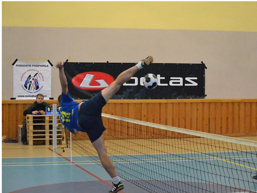
Základná časť slovenskej nohejbalovej ligy – odohrané

Prvú júlovú sobotu sa zápasmi posledného kola skupín východ a stred skončila základná časť SNL mužov. Na rozdiel od minulého roka sme súťaž začínali s počtom družstiev 12, keď sa do ligy neprihlásilo družstvo NK Zalužice. Hneď v úvode sme prišli o ďalšieho účastníka, keď odstúpilo družstvo NK Dobrá Niva, ktoré nedokázalo zabezpečiť dostatok hráčov na odohranie súťažného ročníka.