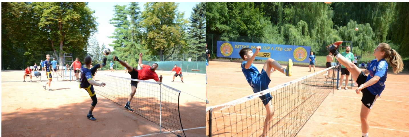
hralo na štyroch antukových/tenisových kurtoch v areáli kúpeľov na Sliači