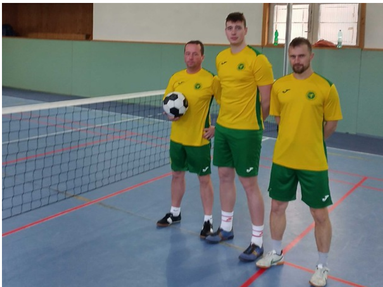
Zimná nohejbalová liga 2022