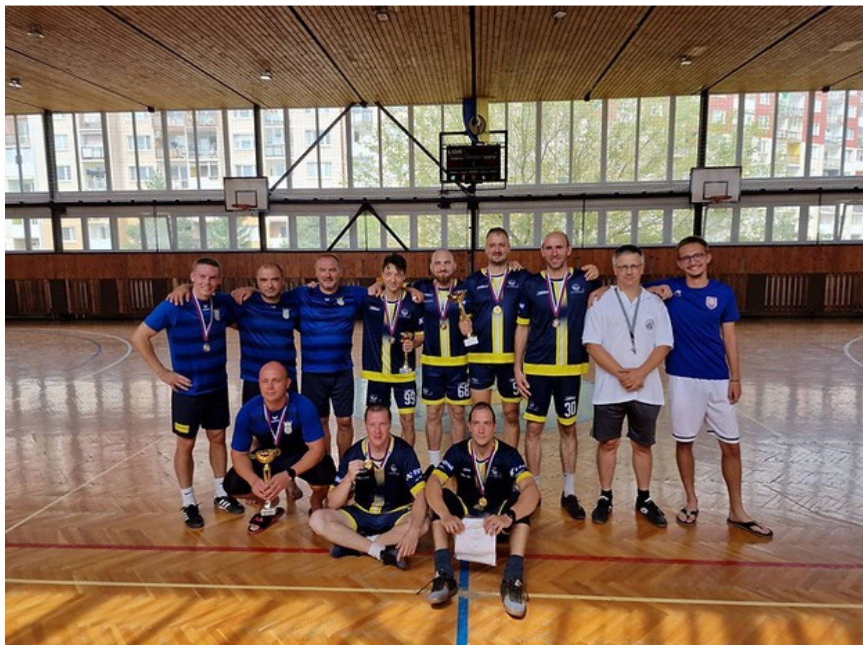
Majstrovstvá slovenska v nohejbale dvojíc mužov 2022