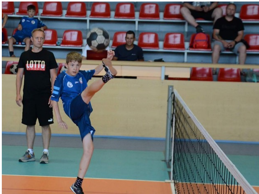
Majstrovstvá SR v nohejbale dvojíc žiakov Snina 2022

Počas víkendu 18. - 19. júna sa v mestskej športovej hale v Snine a strednej odbornej škole Snina uskutočnili Majstrovstvá SR v kategórií žiakov v súťaži trojíc 24. ročník a súťaži dvojíc 22. ročník. V oba dni sa odohrali na dvoch kurtoch v tradične výbornej