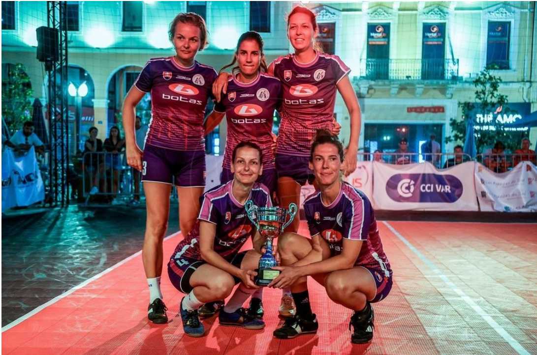
Reprezentácia žien pózuje so striebornou trofejou

Obe naše reprezentácie uspeli nad očakávania a v ženskej i mužskej kategórii vybojovali strieborné trofeje.